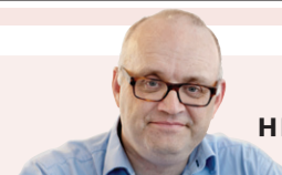
HENRIK ØRHLST ANMELDER