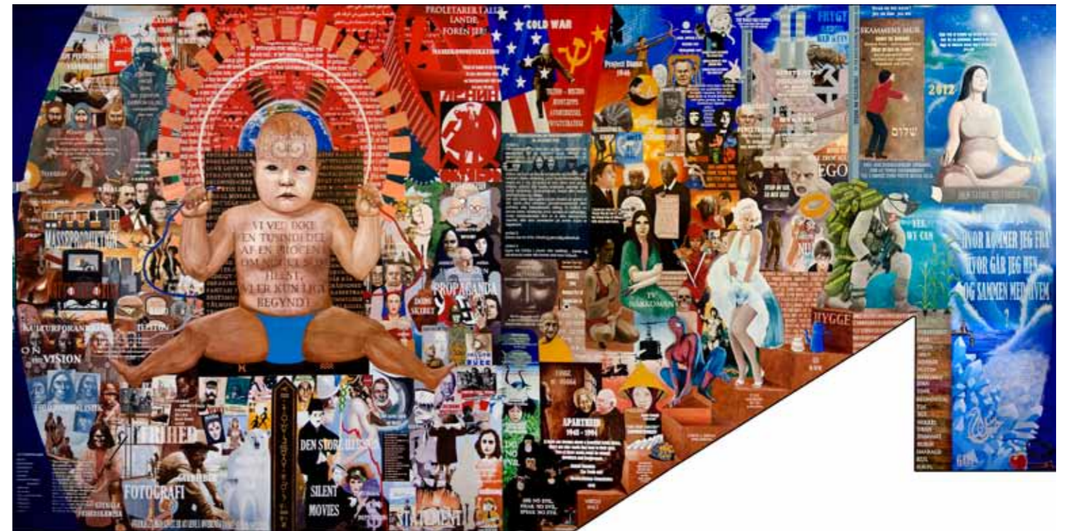
PANEL 1: Fra tidligste tid til år 0