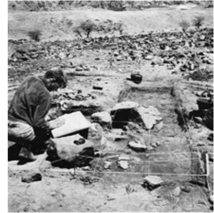
JØRN BIE arkæologisk udgravning i Negev-ørkenen 1964