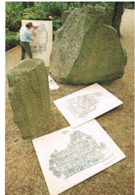
JØRN BIE og Jellingestenen 1965